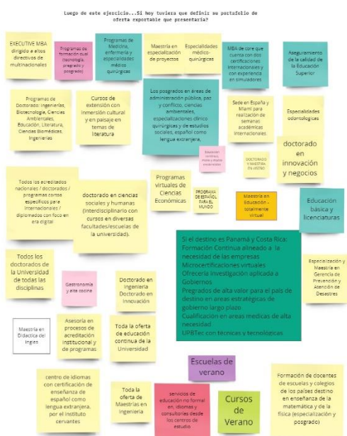
Figura 7 Miro pregunta 4

El portafolio para "HOY" se conformaría de doctorados, formación continua y maestrías. Se destacan en Maestrías los MBA y las especialidades médico-quirúrgicas, en áreas de conocimiento, como Ciencias de la Salud, Administración, Innovación, Diseño, Paz y Conflicto, Ciencias Ambientales, Ingenierías, Biotecnología y Educación.