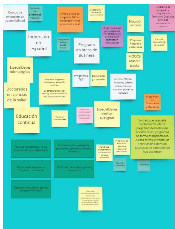
Figura 6 Miro pregunta 3

En esta pregunta, al igual que en la anterior, se ratifica que cada IES tiene una perspectiva particular; sin embargo, se puede identificar que se privilegian los posgrados de maestrías y doctorados. De igual forma, los cursos cortos (educación continua) y las escuelas de verano se identifican como Fortalezas de su Oferta Académica por Niveles de Formación . No obstante, en el desarrollo del ejercicio se evidencian aspectos que,