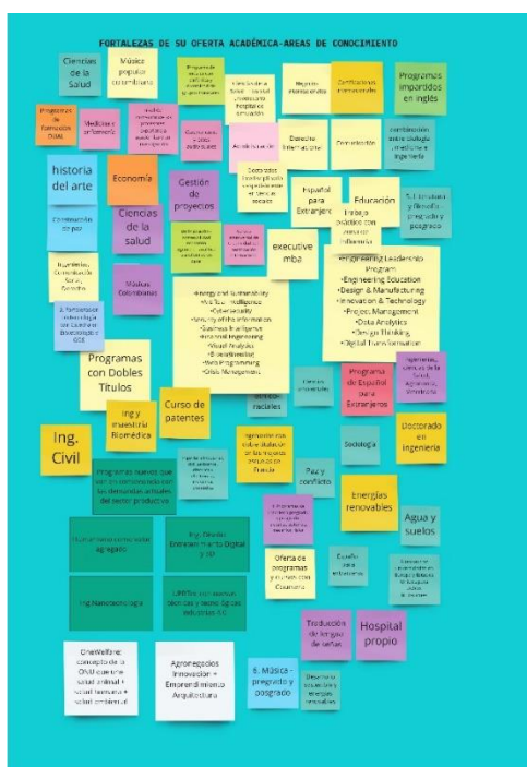
Figura 5 Miro pregunta 2

En esta pregunta se exponen respuestas muy diversas desde lo que las IES presentan como Fortalezas de su Oferta Académica por Área de Conocimiento . Este es un indicador de las particularidades de las IES del sector que, en una primera mirada, no se facilita concentrarlos en una o dos áreas de conocimiento. En este punto será vital lo que se pueda identificar en los mercados de destino como oportunidades y necesidades de formación no resueltas, que puedan moldear la oferta de las instituciones.